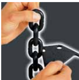
Prüfung des Ø-Verschleißes