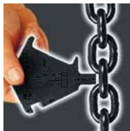
Prüfung der Teilungsverlängerung durch Nenndicken-Verschleiß