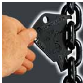
Prüfung der plastischen Längung durch Überlast